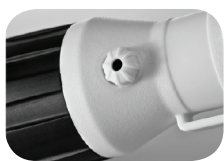
Ventil / valve