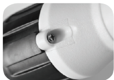
Verschluss / fastener