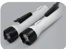
Zwei mögliche Clip-Positionen / two ways position clip